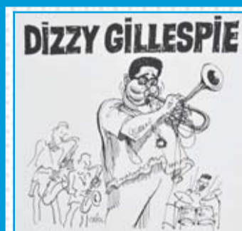
Dizzy Gillespie, une grande figure du jazz de papa...