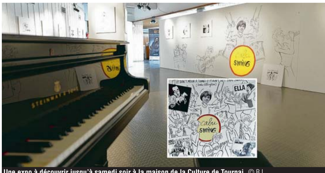
Une expo à découvrir jusqu'à samedi soir à la maison de la Culture de Tournai.

Cabu n'est plus de ce monde. Il a été assassiné le 7 janvier dans les locaux de Charlie Hebdo. Le caricaturiste, dessinateur de presse, aimait le jazz! On peut même évoquer une vieille histoire d'amour. Lorsque l'adolescent Cabu débarque à Paris en 1954 il découvre Charles Trenet à l'Olympia et surtout le jazz de Cab Calloway, qui joue durant les intermèdes des Harlem Globe Trotters en tournée de démonstration à Paris. C'est le début d'une passion pour le jazz, le swing, et les orchestres, qui ne quittera jamais le dessinateur. Pendant plus de cinquante ans, avec ses lunettes et son carnet de croquis, Cabu a discrètement arpenté les salles de concerts et les festivals où l'on célébrait la musique qu'il aimait tant. S'il était encore de ce monde, peut-être aurait-il un jour débarqué au festival de jazz de Tournai qui a