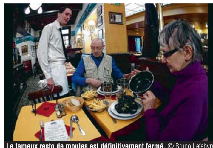
Le fameux resto de moules est définitivement fermé.