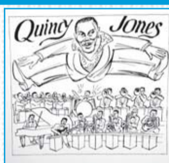
Quincy Jones a notamment accompagné Michaël Jackson